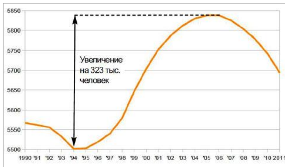
График 1. Население в трудоспособном возрасте в 1991-2011 гг., тыс. чел.

На основании данных Национального статистического комитета Республики Беларусь Изменения в возрастной структуре населения еще более показательны, если обратить внимание на соотношение количества лиц нетрудоспособного возраста к 1000 человек трудоспособного возраста. Если в 1992-1994 гг. на 1000 человек трудоспособного возраста приходилось более 800 нетрудоспособного, то в 2007-2008 гг. — всего 615. Фактически 2007-2008 гг. были годами с наименьшей демографической нагрузкой за всю послевоенную историю Беларуси. Характерно, что именно в пиковый период демографического бонуса — на рубеже 2007 и 2008 гг. — власти Беларуси затеяли реформу системы социальной защиты и отменили многие льготы для различных категорий граждан.